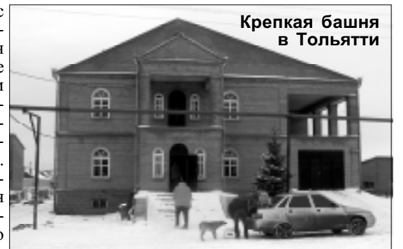
Крепкая башня в Тольятти

- Это не волнует, это радует: здесь на уроки ходишь. И читаешь духовную литературу. А когда читаешь, вдумываешься в слова. И такое открывается! Думаешь - это про меня! И это! Ведь в Библии нет ни одного