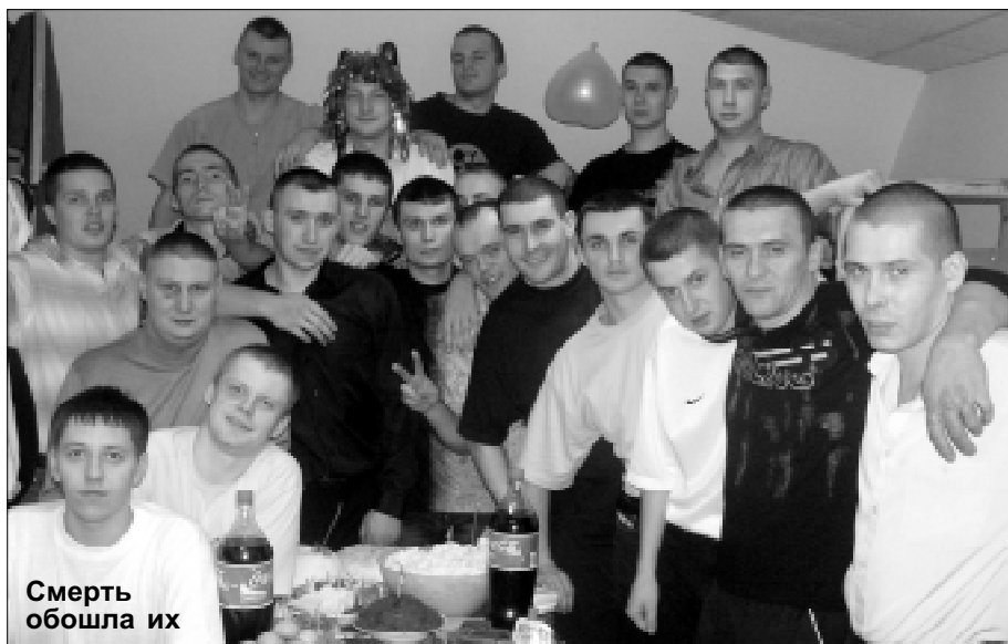
Смерть обошла их